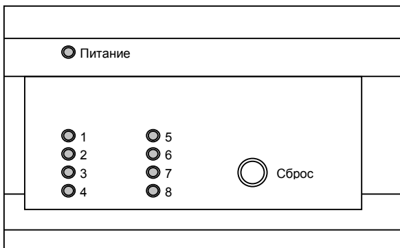
Рис. 1. Внешний вид приёмника

При поданном на приёмник питании и отсутствии тревоги, на передней панели приёмника горит зелёный светодиод «Питание», реле шлейфа выключено (состояние НОРМА). В случае приёма тревожного радиосигнала с любого зарегистрированного передатчика, приёмник переходит в состояние ТРЕВОГА.